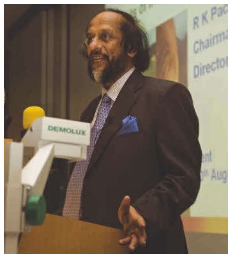
Rajendra Pachauri, président du Conseil sur le climat de l'ONU: « Mangez moins de viande – sa production entraîne de très importantes émissions de CO 2 . »