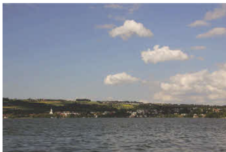
Un paysage idyllique trompeur: le lac de Sempach doit être oxygéné artificiellement depuis les années 1980.

Environ 50 % de la pollution des eaux en Europe est due aux élevages intensifs d'animaux. Les nitrates issus de l'agriculture ont pénétré si profondément dans le sol que certaines marques d'eaux minérales ne répondent plus aux normes de qualité exigées pour l'eau potable. 30 Aux Etats-Unis la part de la pollution des eaux due à l'agriculture est plus importante que celle due à toutes les villes et industries réunies. 31